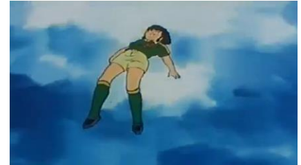
Situation C :

Enfin, James est propulsé en l'air afin de faire une tête plongeante victorieuse, permettant de prendre l'avantage 2-1 en 1/8 e de finale !